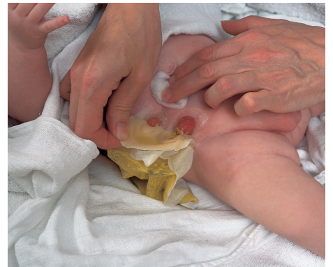
Warmes Badewasser erleichtert die Entfernung der Versorgung.