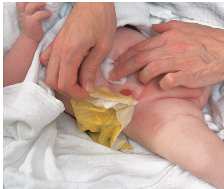
Drücken Sie dabei vorsichtig eine Komresse gegen die Haut, während Sie die Versorgung in die Gegenrichtung abziehen.