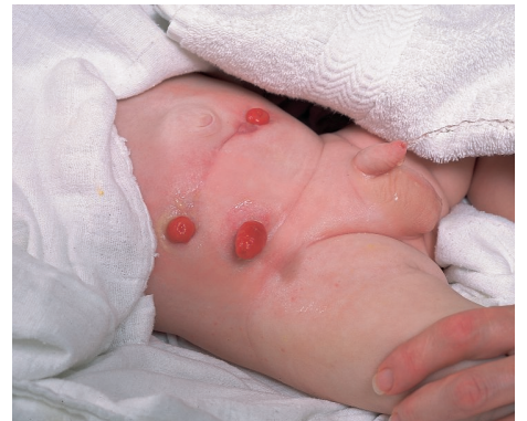
Wenn Sie sicher sind, dass die Haut absolut trocken ist, kann die neue Versorgung angebracht werden.