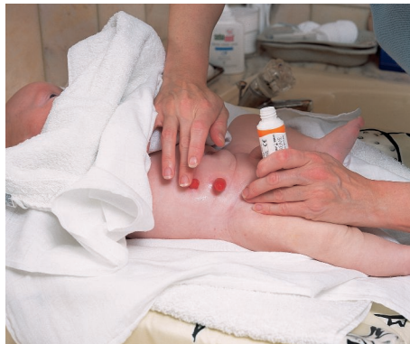
Bemerken Sie eine leichte Rötung der Haut, können Sie diese mit (nichtfettender) Dansac Skin Creme behandeln und damit einer Hautirritation vorbeugen. (Bitte vollständig einmassieren).