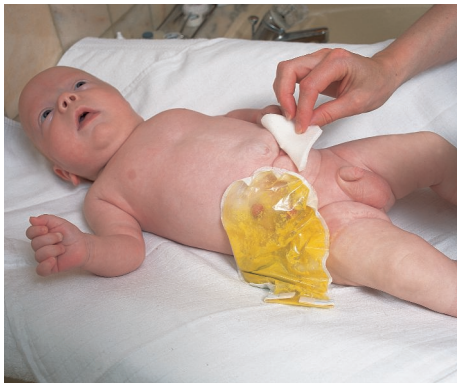
Nach dem Trocknen beginnen Sie mit dem Ablösen der alten Versorgung.

Die Passage des Stuhlgangs ist unterbrochen durch einen Darmteil, der noch nicht ausgereift ist.