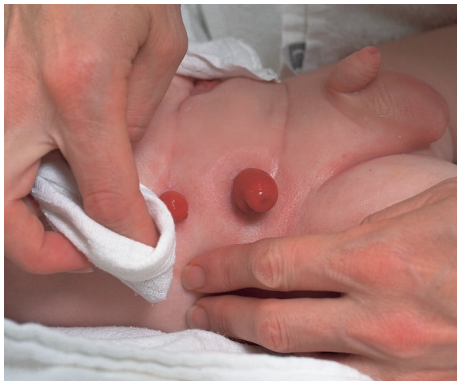
Trocknen Sie die Hautumgebung des Stomas sorgfältig.