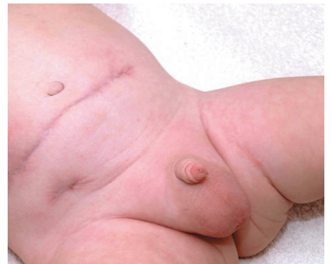
Vier Monate nach seiner ersten Operation konnte Emils Stoma zurückverlegt werden. Die Verdauung nimmt ihren üblichen Weg ohne Probleme. Die einzige Erinnerung an das Stoma ist die Narbe auf dem Bäuchlein.

In den meisten Fällen kann ein Stoma in den üblichen Darmverlauf zurückverlegt werden; manchmal schon nach 2-6 Monaten.