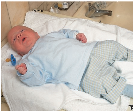
Die Stomaversorgung und -pflege sind normalerweise keine unangenehmen Erlebnisse für das Kind. Es wird direkt nach dem Versorgungswechsel wieder anfangen, ungehindert die Welt für sich zu entdecken.